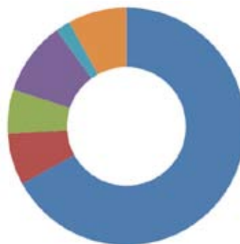
Math o ymholiad

Rydym yn defnyddio meini prawf cymhwyster (gweler Atodiad 1) i sicrhau bod ein hadnoddau cyfyngedig yn cael eu defnyddio ar gyfer y bobl sydd â'r angen mwyaf am ein cymorth. Nid ydym yn cynorthwyo pobl sy'n debygol o elwa'n ariannol o benderfyniad cynllunio – cyfeirir y bobl hyn at restr o ymgynghorwyr cynllunio ardstyedig. Dengys y siartiau isod gymhwyster cleientiaid y Llinell Gymorth dros y flwyddyn ddiwethaf, ynghyd â'r mathau o gwestiynau a dderbyniwyd: