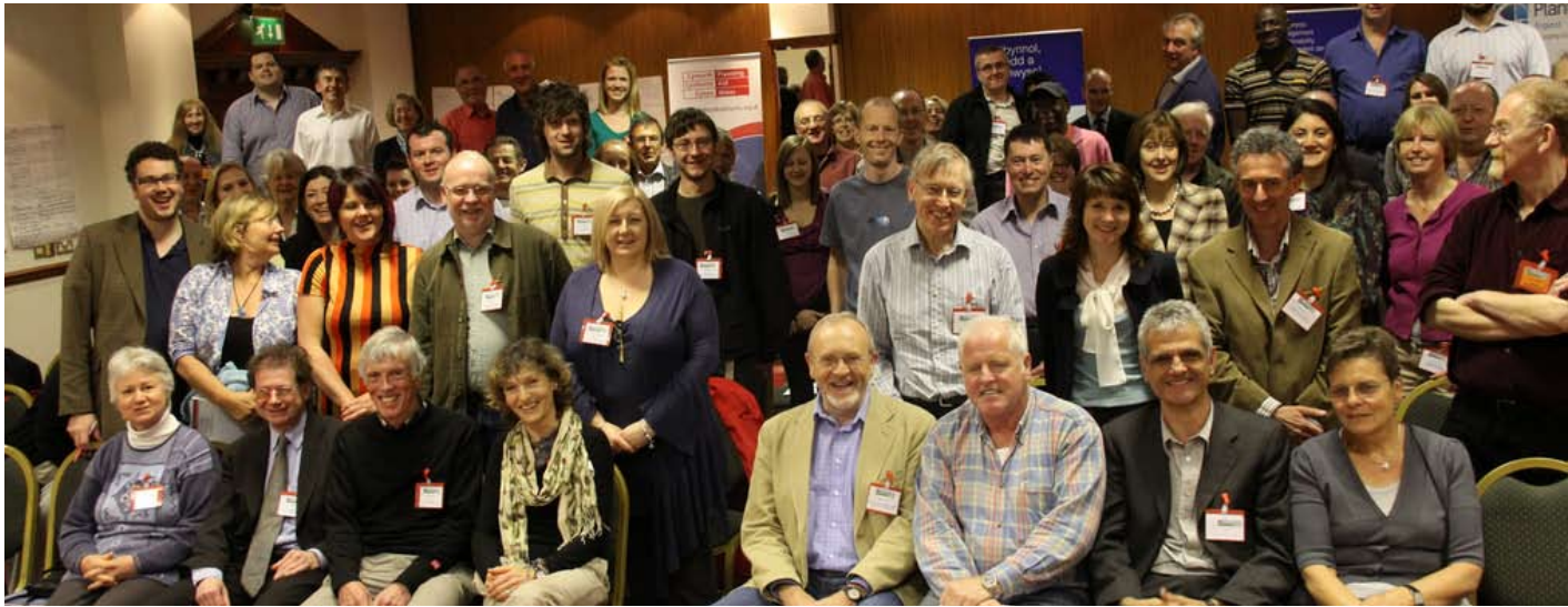
Cynhaldedd Genedlaethol Cymorth Cynllunio, Caerdydd, Ebrill 2010