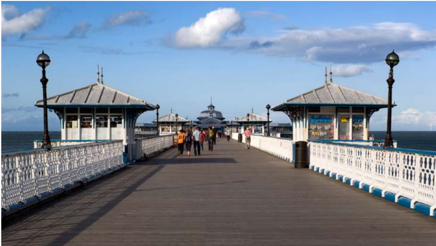
Pier Fictorianaidd Llandudno

M ae Cymorth Cynllunio Cymru yn parhau i ddarparu gwasanaeth cyngor o ansawdd uchel ar Linell Gymorth, gyda chymorth gan wirfoddolwyr sy'n gynllunwyr cymwys. Rhwng Ebrill 2010 a Mawrth 2011 derbyniasom bron i bedwar cant o alwadau yn gofyn am wybodaeth, cyngor a chymorth ar ystod eang o faterion cynllunio. Hefyd rhoesom gymorth i 26 grŵp cymunedol gyda chyfanswm o 730 o aelodau dros y flwyddyn.